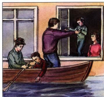
В первую очередь из зоны затопления вывести детей