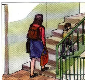
Перенести на верхние этажи продовольствие, ценные вещи, одежду, обувь