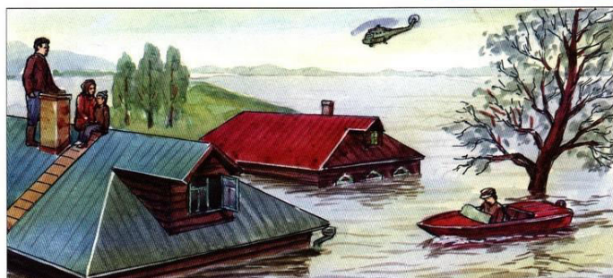
Спасти людей, где бы они ни оказались, используя для этого любые средства