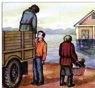
Эвакуировать население из опасных районов