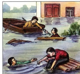
Оказать срочную помощь людям очутившимся в воде